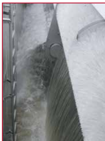
Installatie in werking tijdens een overstort