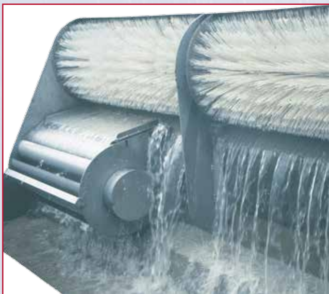
Een Morselt Hydroclean borstelinstallatie in bedrijf.

Borstelzeefinstallatie voor overstorten, zelfreinigend en zonder energie.