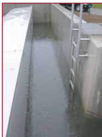
Een hevige regenbui kan een overstort veroorzaken