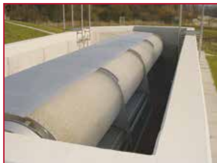
Installatie in rust